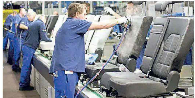
Rivestimento dei sedili in pelle per autovetture